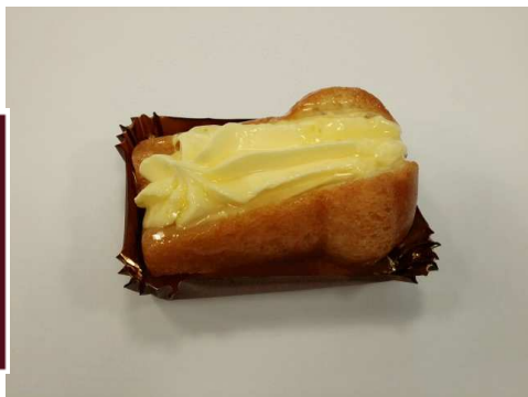
Immagine a scopo illustrativo